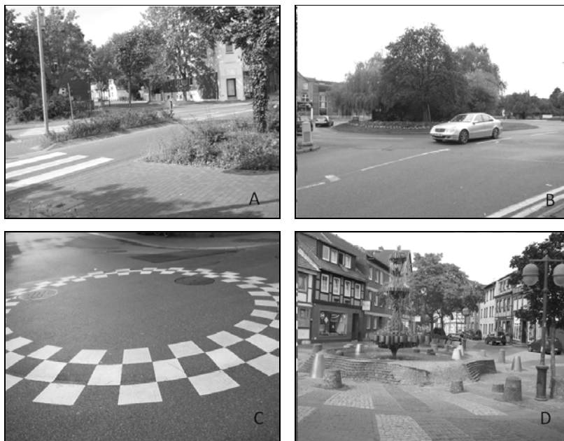
Photo. 6. „Islands and refuges”: A. „Refuge” at pedestrian crossing (Uelzen, Germany); B. Roundabout with

Fot. 6. „Wyspy i azyle”: A. „Azyl” przy przejściu dla pieszych (Uelzen, Niemcy); B. Rondo z zielenią wysoką (Sheffield, W. Brytania); C. Małe rondo z niewielkim wyniesieniem i oznaczeniami poziomymi (Zurich, Szwajcaria); D. Rondo w strefie staromiejskiej z fontanną (Uelzen, Niemcy).