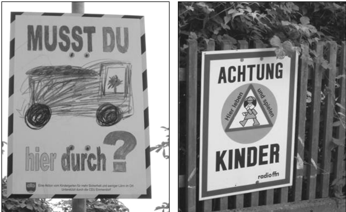
Fot. 1. Edukacyjne plakaty i znaki przy drogach w Emmendorf (Niemcy). Photo 1. Education posters and signs near roads in Emmendorf (Germany).

Ponadto szczególne znaczenie ma edukacja społeczeństwa na poziomie szkolnym i pozaszkolnym oraz różnych grup wiekowych w zakresie bezpieczeństwa na drodze. Propagowane są również projekty i akcje wspomagające działania edukacyjne (fot. 1).