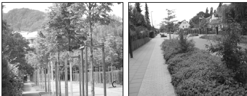
C. Aleja wewnętrzna na osiedlu (Zurich, Szwajcaria); D. Pojedyncze nasadzenia podścielone niskimi krzewami (Uelzen, Niemcy).

Photo 5. Entry gates to towns and settlements. A. Green road walls with low hedges and high poplars; B. „Green wall” in the middle line separated road. At a background – groups of shrubs on a viaduct (Zurich, Switzerland); C. Internal alley in the residential district (Zurich, Switzerland); D. Singular planter trailed with low shrubs (Uelzen, Germany).