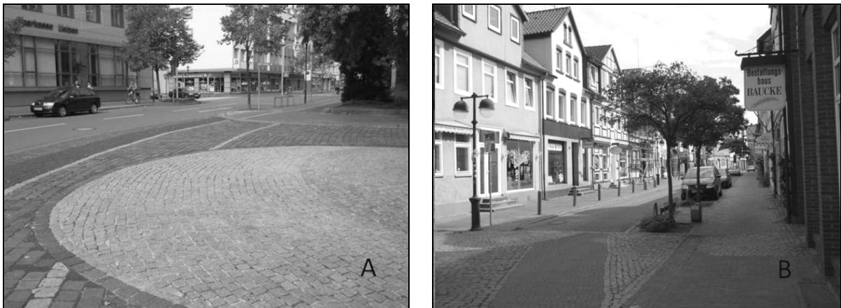
Fot. 3. Poziome odgięcia (Uelzen, Niemcy).

Poprzez pionowe odgięcie jezdni można wymusić na kierowcy redukcję prędkości poprzez fizyczny dyskomfort odczuwany w przypadku niedostosowania prędkości do sytuacji na drodze. Chcąc przejechać próg, czy też innego rodzaju wyniesienie w sposób łagodny i bezpieczny (dla kierowcy i pojazdu), musi on odpowiednio obniżyć prędkość jazdy. Budowa tego rodzaju środków uspokojenia ruchu nie wymaga zastosowania zieleni, niemniej jednak zmiana charakteru drogi poprzez wprowadzenie zróżnicowanych materiałów w nawierzchni (w odniesieniu do struktury, faktury, koloru) zdecydowanie zwiększy pożądaną efekt poprzez zwrócenie uwagi kierowcy na zmieniające się otoczenie. Poprawia to koncentrację. Podobny zabieg można uzyskać wprowadzając dodatkowo powierzchnię trawnika (fot. 3).