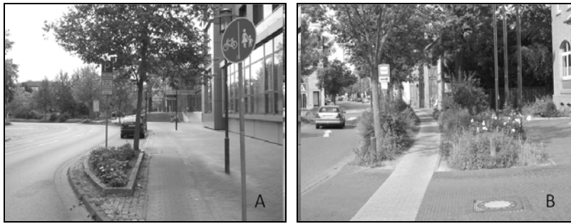
Fot. 4. Odgięcia jezdni: A. Odgięcie przy wjeździe z wewnętrznej ulicy (Uelzen, Niemcy); B. Pasy zieleni przy jezdni i ścieżce rowerowej (Uelzen, Niemcy); C. Pasy oddzielające jezdnie od strefy postojowej (Zurich, Szwajcaria); D. Odgięcie przy łuku w strefie ronda (Uelzen, Niemcy).