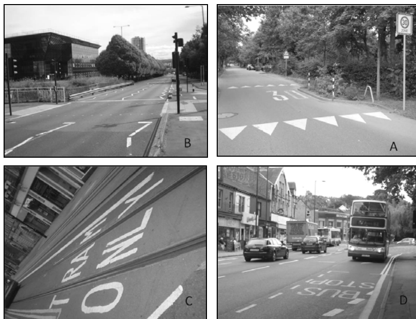
Fot. 2. Poziome odgięcia jezdni oraz stosowanie oznakowania dla separacji ruchu. Przykłady: A. Uelzen (Niemcy); B. Zurich (Szwajcaria); C, D. Sheffield (W. Brytania).

Poziome odgięcie jezdni to sposób na wymuszenie u kierowcy zmniejszenia prędkości ze względu na konieczność (większej lub mniejszej) korekty toru jazdy. Odgięcie jezdni można wykonać przy okazji przebudowy poprzez wykonanie nasadzeń roślinności wysokiej w przypadku szerszego pasa przydrożnego lub też niskiej, gdy pas przy drodze jest węższy. Jest to dość prosty sposób wymuszenia na kierowcy koncentracji i skupienia uwagi na najbliższym otoczeniu. Do tej kategorii zalicza się również całkowite zamknięcie niektórych relacji (np. na wprost) i zmuszenie kierowcy do wykonania manewru w prawo lub w lewo, czyli zupełnej korekty toru jazdy (fot. 2).